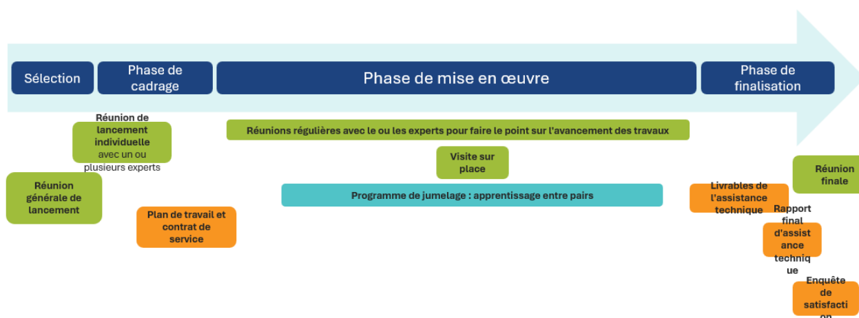
Figure 1 : Parcours du bénéficiaire du CEAH

Pour les bénéficiaires sélectionnés lors du premier appel à candidatures du CEAH, le parcours d'assistance technique devrait débuter au printemps 2026.