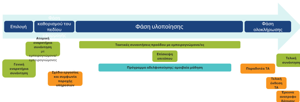
Σχήμα1 : Διαδρομή του δικαιούχου της CEAH

Για τους επιλεγμένους δικαιούχους από την πρώτη πρόσκληση υποβολής αιτήσεων της CEAH, η τεχνική βοήθεια αναμένεται να ξεκινήσει την άνοιξη του 2026.